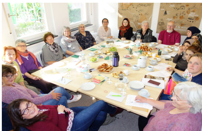
Fotos (von oben nach unten): Wochenende der Nachbarschaften, BENN-Sprachcafé, BENN-Ehrenamtsstammtisch

Arbeitsgemeinschaft für Sozialplanung und angewandte Stadtforschung e. V. - AG SPAS Berlin, April 2019