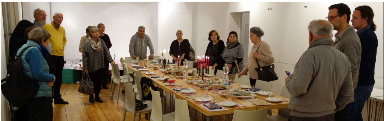
Foto: Zur Würdigung ehrenamtlichen Engagements wurde am 03.12.2018 ein gemütliches Beisammensein im Jugendmuseum Tempelhof-Schöneberg organisiert.

Die Anerkennung von Engagement und die Anbindung von Aktiven an bestehende Strukturen ist ein zentrales Element der Tätigkeit des BENN-Teams. So konnten zum Beispiel zwei Ehrenamtliche für die Unterstützung der Kinderbetreuung während der Sprachkurse in der katholischen Gemeinde gewonnen werden. Zur Würdigung des bürgerschaftlichen Engagements hat das BENN-Team für eine gemischte (Deutsch/Arabisch) Gruppe ehrenamtlich Engagierter ein feierliches Beisammensein zum Jahresausklang 2018 organisiert. Zu diesem Zweck wurde die Villa Global im Jugendmuseum Tempelhof-Schöneberg besucht, wo unter fachlicher Begleitung die Ausstellung „Villa Global“ erkundet werden konnte. Beim gemeinsamen Essen fand ein reger Austausch statt.