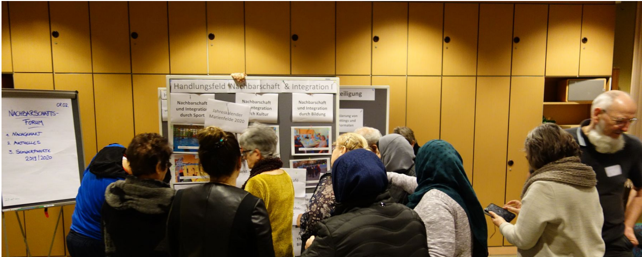
Foto: Priorisierung im Rahmen des BENN-Nachbarschaftsforums am 07.03.2019 in der Seniorenfreizeitstätte Eduard Bernoth.

Die Bedarfe und Handlungsziele sollen auch künftig eng mit den Akteuren im BENN-Gebiet abgestimmt sowie mit den Menschen im BENN-Gebiet weiterentwickelt werden. Zudem sollen erste strategische Überlegungen angeregt werden zur Weiterführung von BENN-Aktivitäten nach Beendigung des Verfahrens.